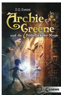
Archie Greene und die Bibliothek der Magie (Band 1)