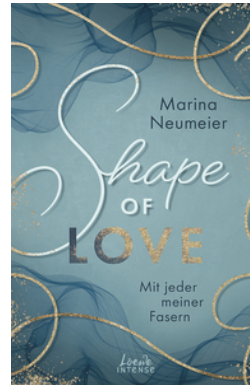
Shape of Love - Mit jeder meiner Fasern (Love-Trilogie, Band 1)