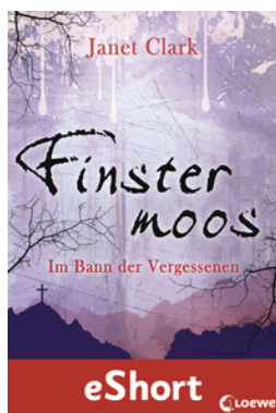
Finstermoos – Im Bann der Vergessenen