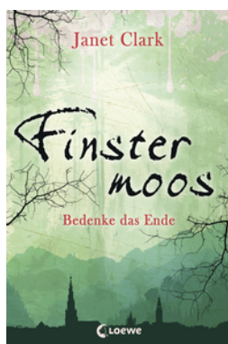
Finstermoos – Bedenke das Ende