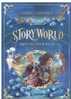
StoryWorld (Band 1) - Amulett der Tausend Wasser