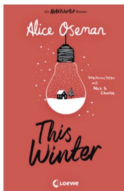
This Winter (deutsche Ausgabe)