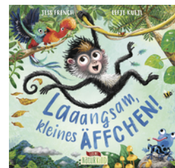
Laaangsam, kleines Äffchen!