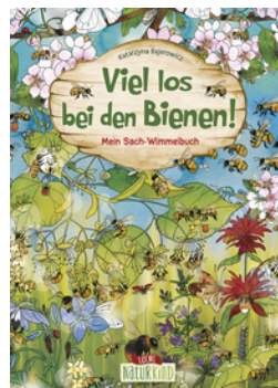
Viel los bei den Bienen!