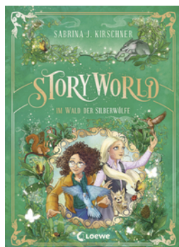
StoryWorld (Band 2) - Im Wald der Silberwölfe