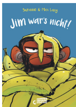
Jim war's nicht!