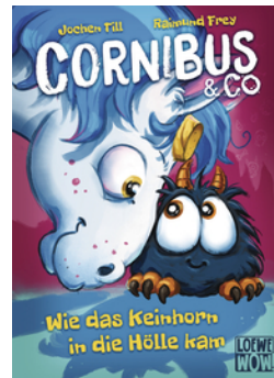
Cornibus & Co. (Band 4) - Wie das Keinhorn in die Hölle kam