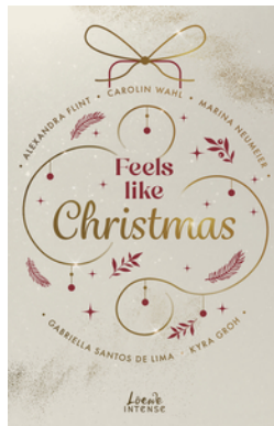
Feels like Christmas