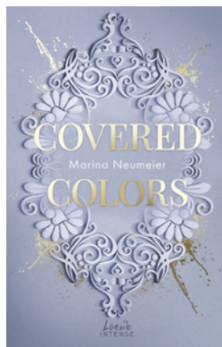
Covered Colors (Golden Hearts, Band 2)