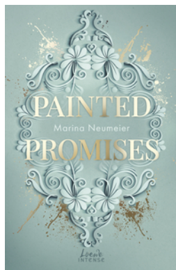
Painted Promises (Golden Hearts, Band 3)