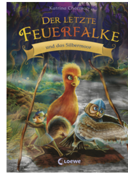
Der letzte Feuerfalke und das Silbermoor (Band 8)