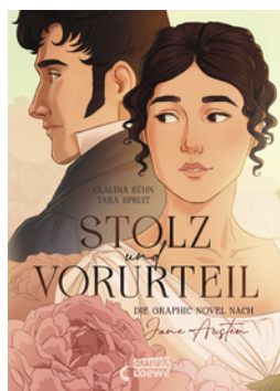
Stolz und Vorurteil - Die Graphic Novel nach Jane Austen