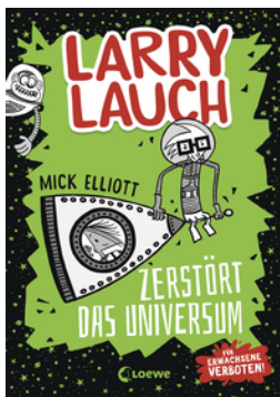
Larry Lauch zerstört das Universum (Band 2)