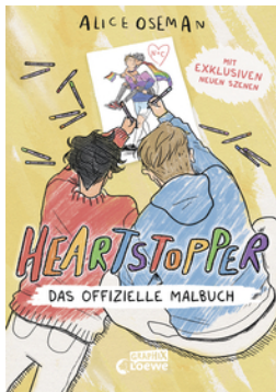
Heartstopper - Das offizielle Malbuch