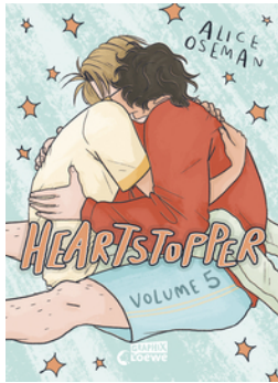
Heartstopper Volume 5 (deutsche Hardcover-Ausgabe)