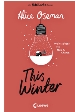
This Winter (deutsche Ausgabe)