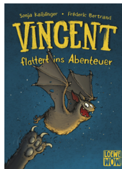
Vincent flattert ins Abenteuer (Band 1)