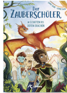
Der Zauberschüler (Band 3) - Im Schatten des roten Drachen