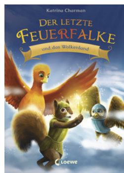
Der letzte Feuerfalke und das Wolkenland (Band 7)