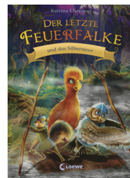
Der letzte Feuerfalke und das Silbermoor (Band 8)