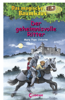
Das magische Baumhaus (Band 2) - Der geheimnisvolle Ritter