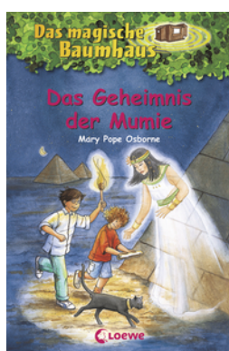
Das magische Baumhaus (Band 3) - Das Geheimnis der Mumie