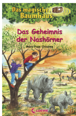
Das magische Baumhaus (Band 61) - Das Geheimnis der Nashörner