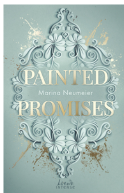
Painted Promises (Golden Hearts, Band 3)