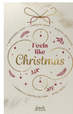
Feels like Christmas