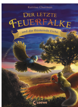
Der letzte Feuerfalte und die flüsternde Eiche (Band 3)