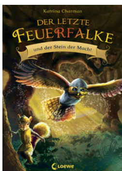
Der letzte Feuerfalte und der Stein der Macht (Band 1)