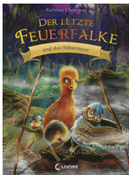
Der letzte Feuerfalte und das Silbermoor (Band 8)