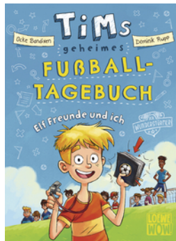
Tims geheimes Fußball- Tagebuch (Band 1) - Elf Freunde und ich!