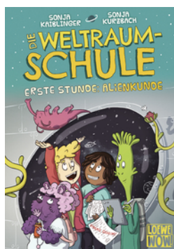
Die Weltraumschule (Band 1) - Erste Stunde: Alienkunde