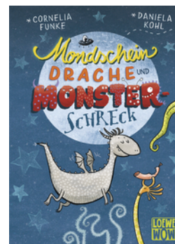
Mondscheindrache und Monsterschreck