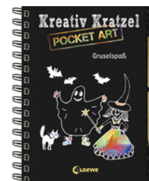
Kreativ-Kratzel Pocket Art: Gruselspaß