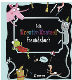
Mein Kreativ-Kratzel Freundebuch