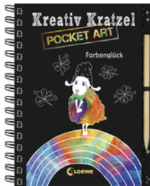
Kreativ-Kratzel Pocket Art: Farbenglück