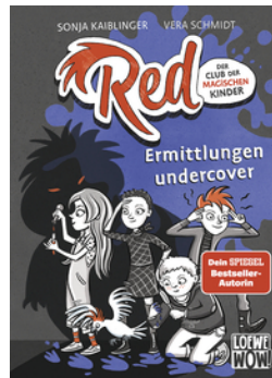
Red - Der Club der magischen Kinder (Band 2) - Ermittlungen undercover