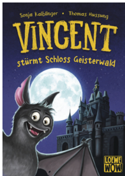
Vincent stürmt Schloss Geisterwald (Band 4)