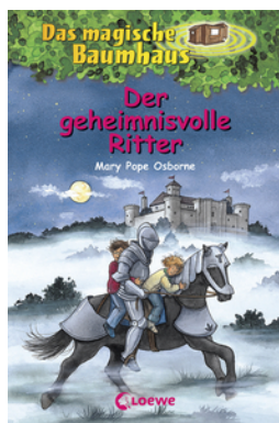
Das magische Baumhaus (Band 2) - Der geheimnisvolle Ritter