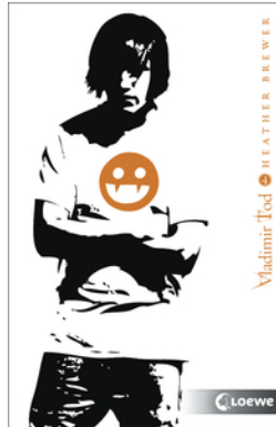
Vladimir Tod kämpft verbissen (Band 4)