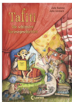
Tafiti - Die schönsten Vorlesegeschichten