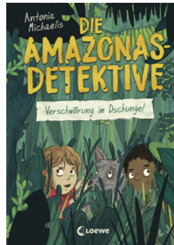
Die Amazonas-Detektive (Band 1) - Verschwörung im Dschungel