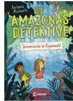
Die Amazonas-Detektive (Band 3) - Spurensuche im Regenwald