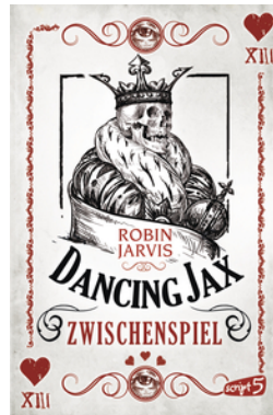
Dancing Jax – Zwischenspiel