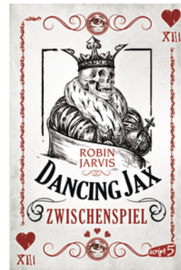
Dancing Jax – Zwischenspiel