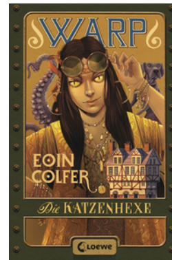
WARP – Die Katzenhexe