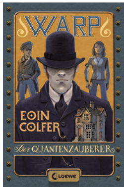
WARP – Der Quantenzauberer