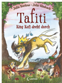
Tafiti - King Kofi dreht durch (Band 21)