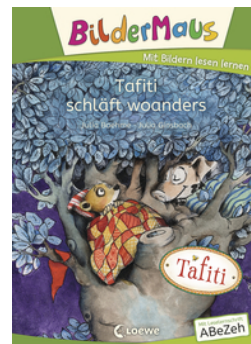
Bildermaus - Tafiti schläft woanders