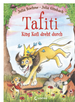
Tafiti - King Kofi dreht durch (Band 21)