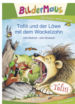
Bildermaus - Tafiti und der Löwe mit dem Wackelzahn