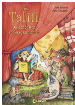
Tafiti - Die schönsten Vorlesegeschichten