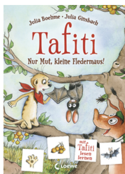
Tafiti - Nur Mut, kleine Fledermaus!