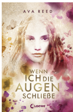
Wenn ich die Augen schließe