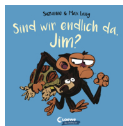
Sind wir endlich da, Jim?