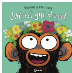
Jim ist gut drauf