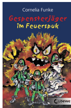
Gespensterjäger im Feuerspuk