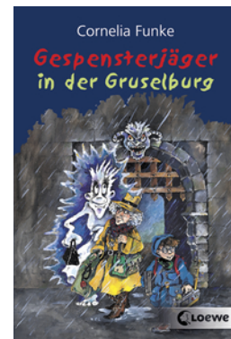
Gespensterjäger in der Gruselburg