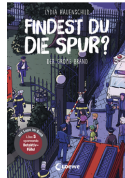
Findest du die Spur? - Der große Brand