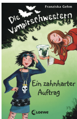
Die Vampirschwestern (Band 3) - Ein zahnharter Auftrag