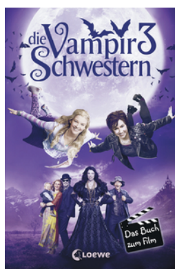
Die Vampirschwestern 3 – Das Buch zum Film