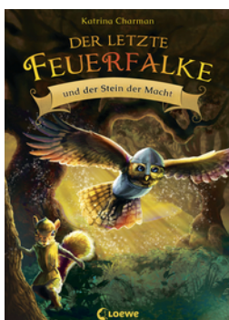
Der letzte Feuerfalke und der Stein der Macht (Band 1)