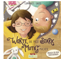
Worte, die mich stark und mutig machen