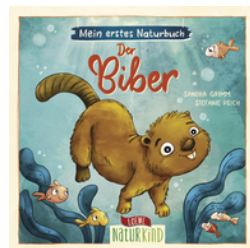
Mein erstes Naturbuch - Der Biber