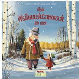
Mein Weihnachtswunsch für dich