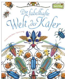
Die fabelhafte Welt der Käfer