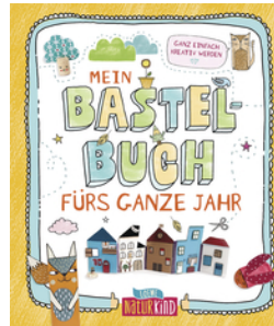
Mein Bastelbuch fürs ganze Jahr