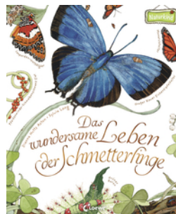
Das wundersame Leben der Schmetterlinge