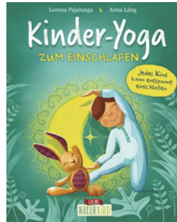
Kinder-Yoga zum Einschlafen