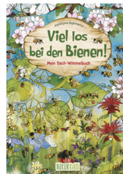
Viel los bei den Bienen!