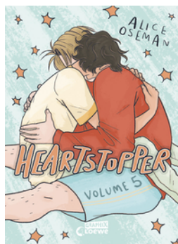
Heartstopper Volume 5 (deutsche Hardcover-Ausgabe)