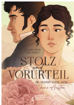
Stolz und Vorurteil