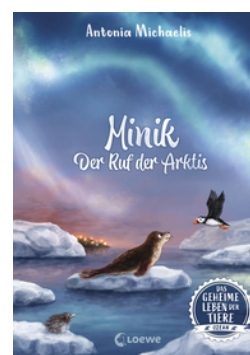
Das geheime Leben der Tiere (Ozean) - Minik - Der Ruf der Arktis