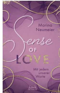
Sense of Love - Mit jedem unserer Worte (Love-Trilogie, Band 3)