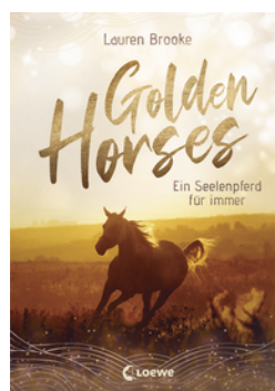
Golden Horses (Band 1) - Ein Seelenpferd für immer