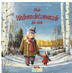
Mein Weihnachtswunsch für dich