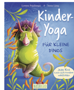
Kinder-Yoga für kleine Dinos