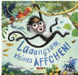
Laaangsam, kleines Äffchen!