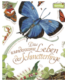
Das wundersame Leben der Schmetterlinge