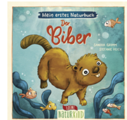
Mein erstes Naturbuch - Der Biber