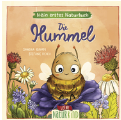
Mein erstes Naturbuch - Die Hummel