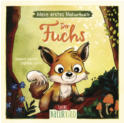
Mein erstes Naturbuch - Der Fuchs