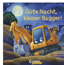
Gute Nacht, kleiner Bagger!