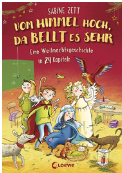
Vom Himmel hoch, da bellt es sehr - Eine Weihnachtsgeschichte in 24 Kapiteln