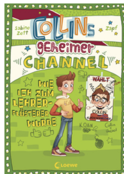
Collins geheimer Channel (Band 3) - Wie ich zum Lehrerflüsterer wurde