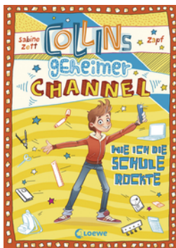
Collins geheimer Channel (Band 2) - Wie ich die Schule rockte