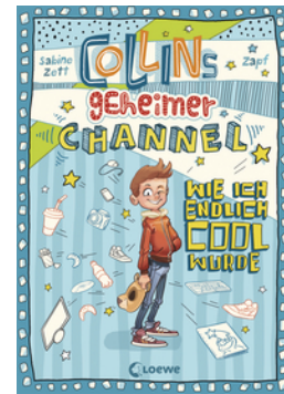
Collins geheimer Channel (Band 1) - Wie ich endlich cool wurde