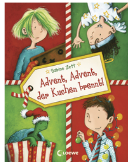
Advent, Advent, der Kuchen brennt!