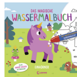
Das magische Wassermalbuch - Einhörner