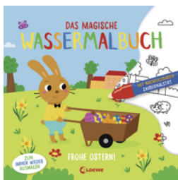
Das magische Wassermalbuch - Frohe Ostern!