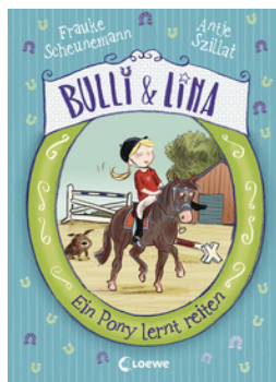
Bulli & Lina (Band 2) - Ein Pony lernt reiten