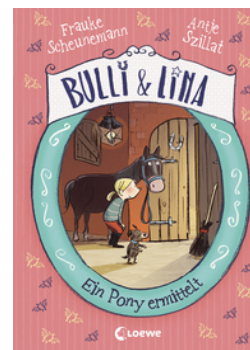
Bulli & Lina (Band 4) - Ein Pony ermittelt